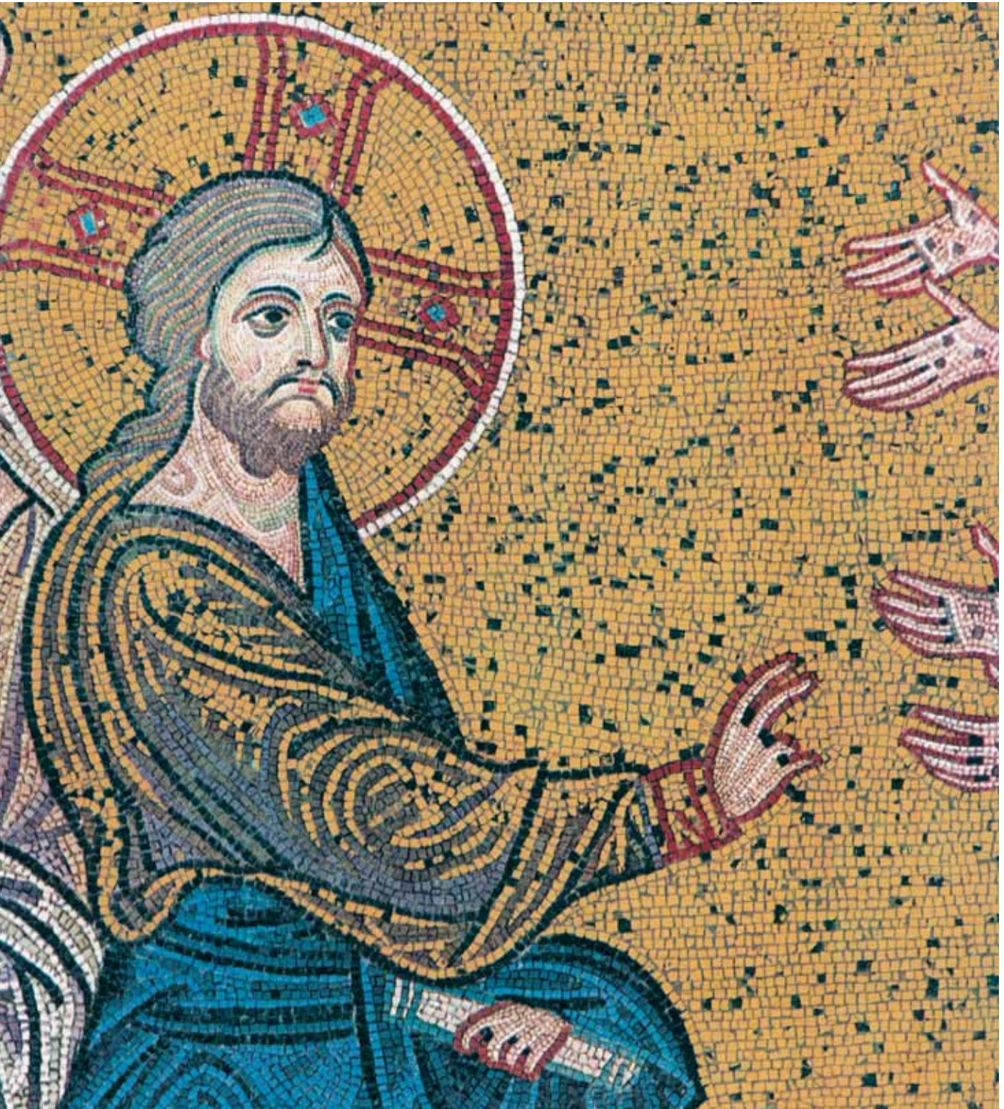
Guarigione dei dieci lebbrosi, particolare