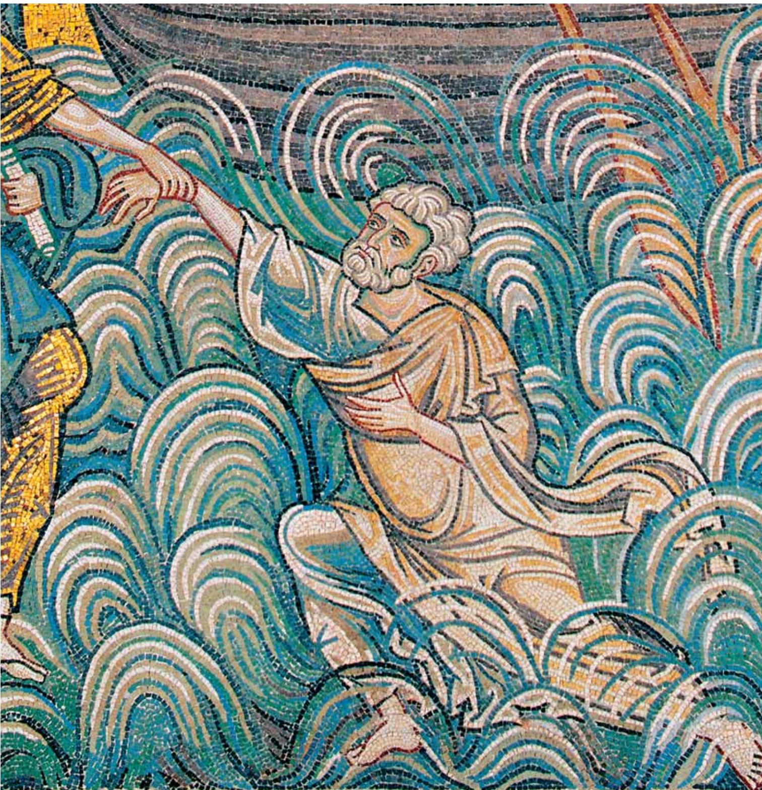
Gesù salva Pietro dalle acque, particolare