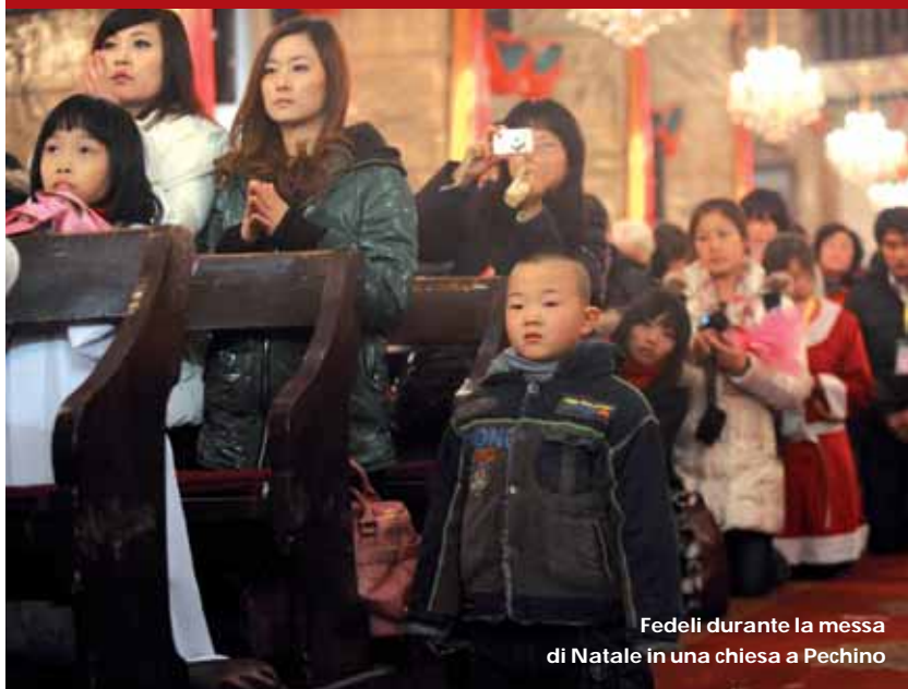
Fedeli durante la messa di Natale in una chiesa a Pechino