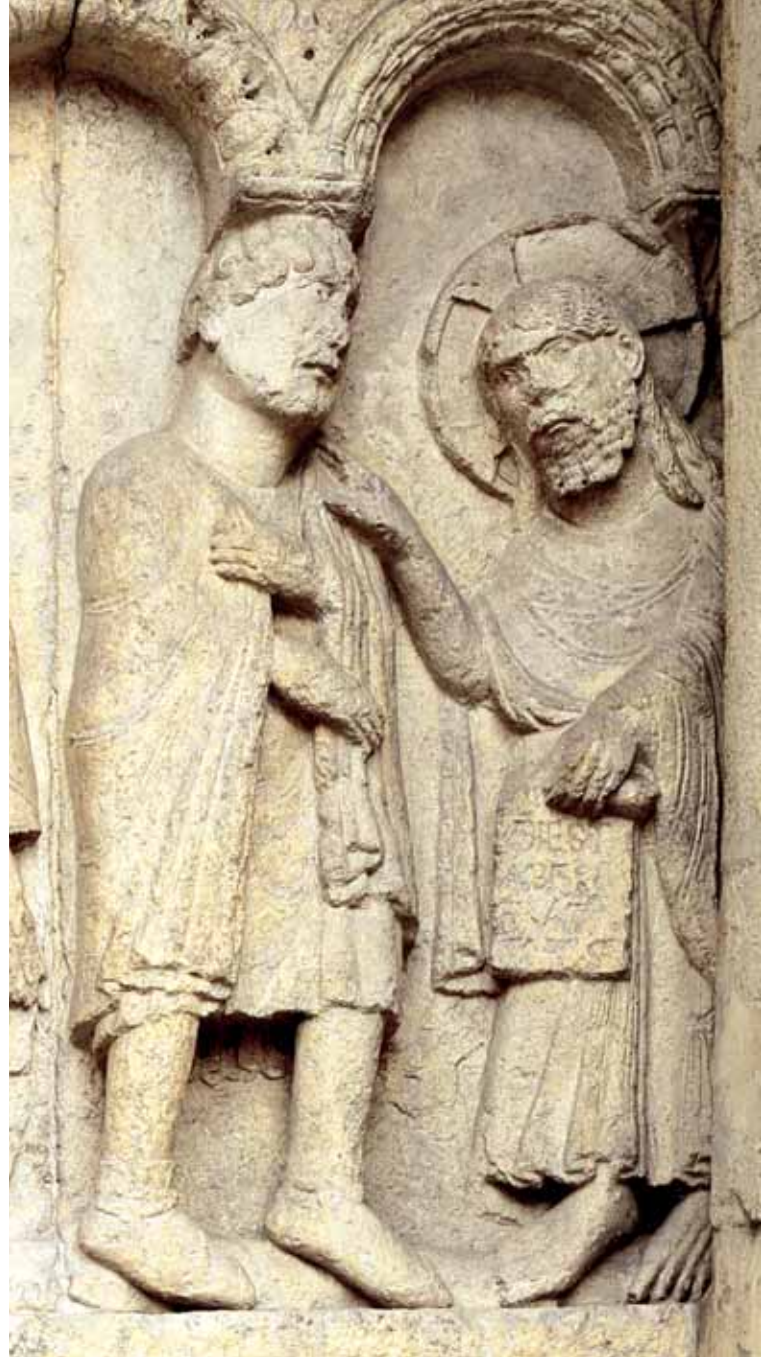
Dio rimprovera Caino

In conclusione, dunque, padre Cipriani ci ricorda opportunamente che è il sacramento la sorgente della vera immagine della Chiesa, proprio perché essa celebrandolo non dimostra alcunché (de-